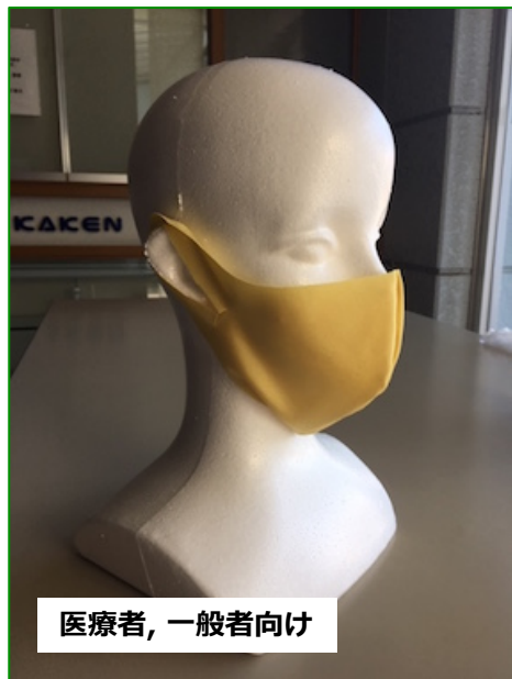
医療者, 一般者向け